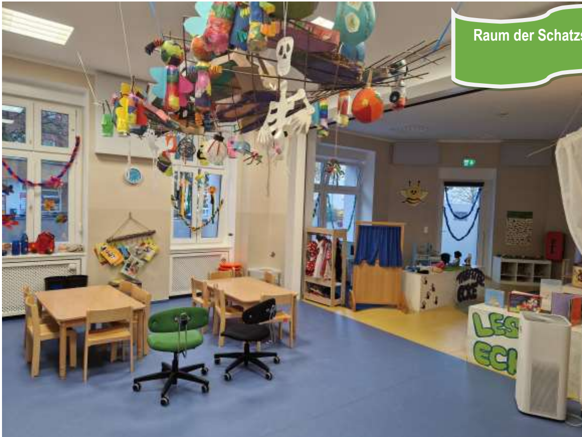
Raum der Schatzsucher