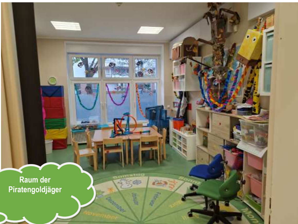
Raum der Piratengoldjäger